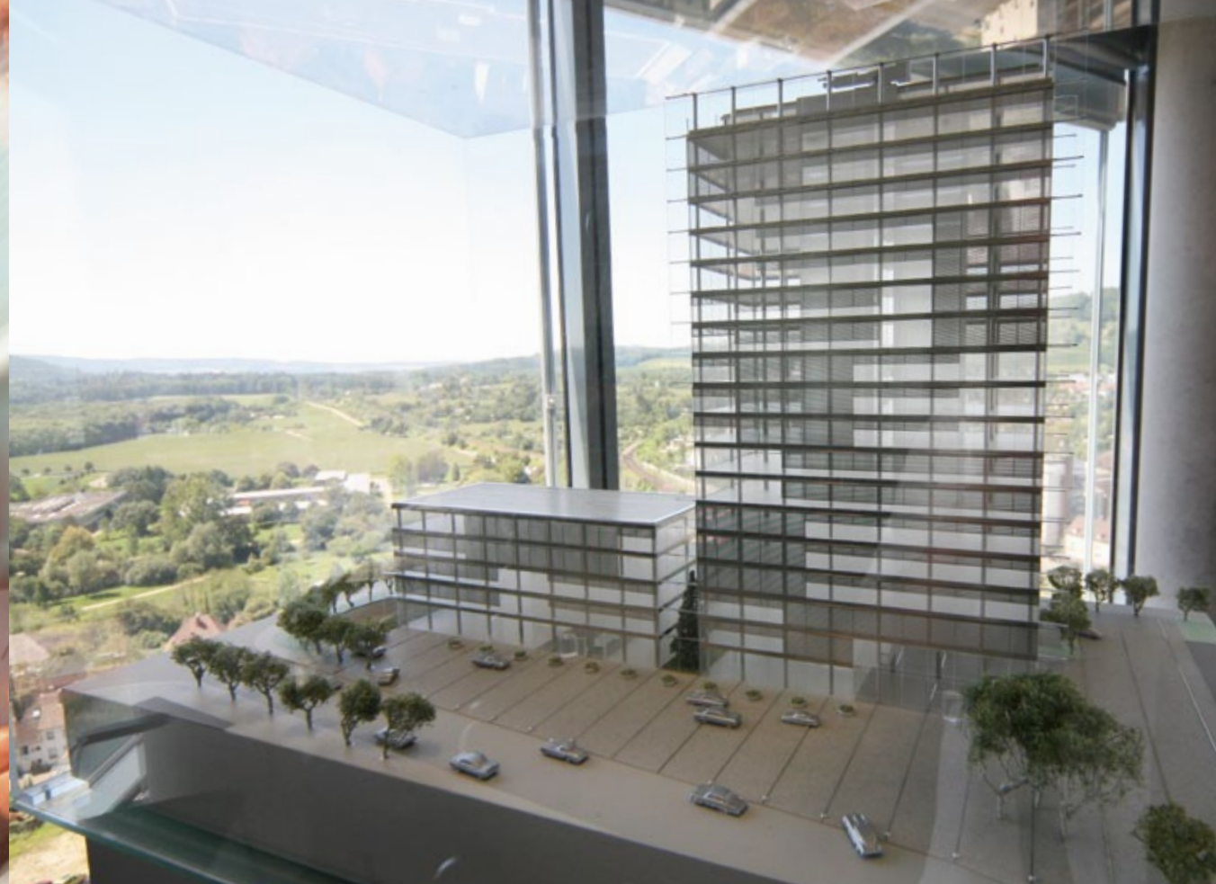
Architekturmodell des Hegau Towers in Singen