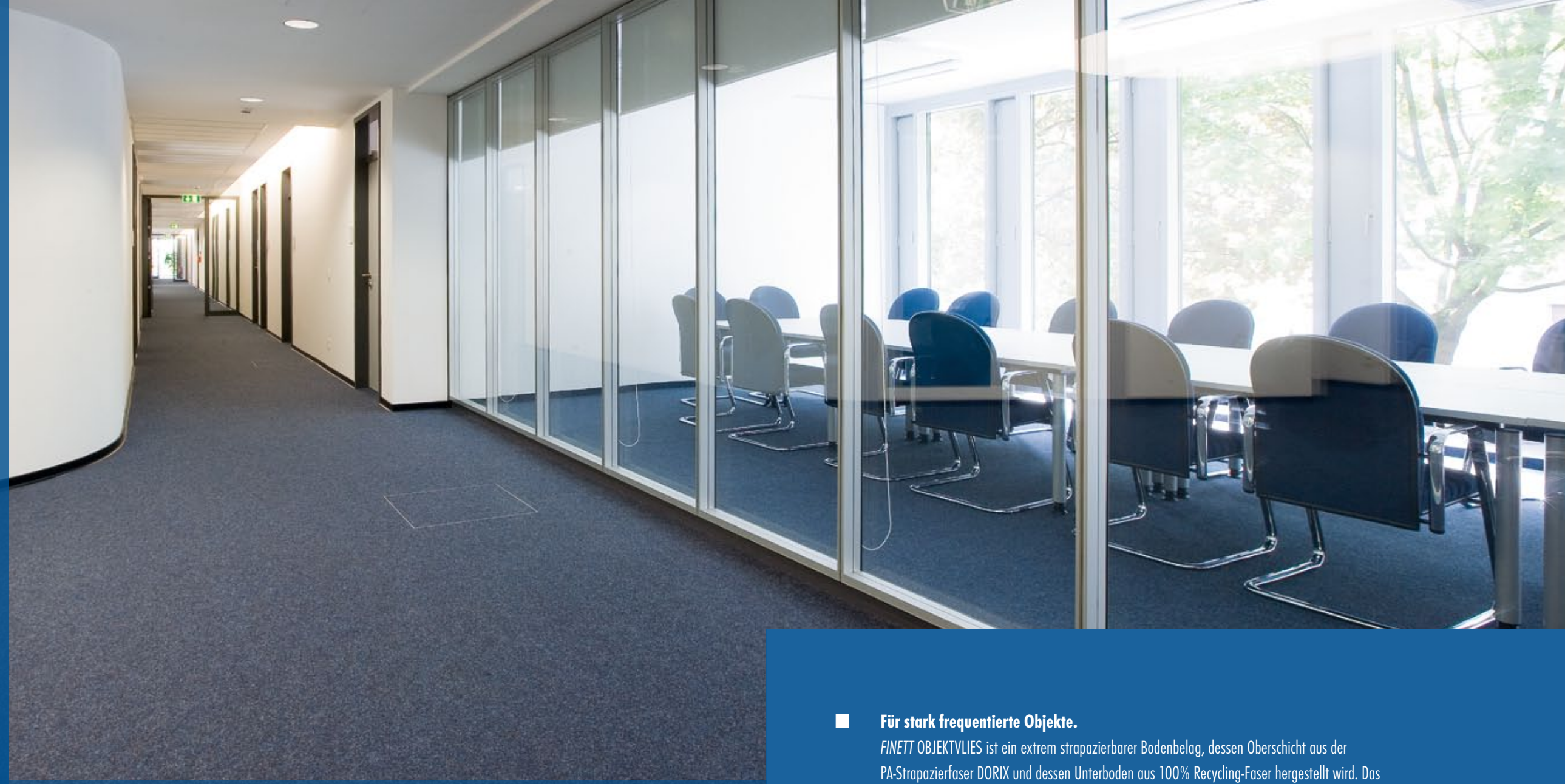
FINETT SELECT im neuen Rathaus in Solingen